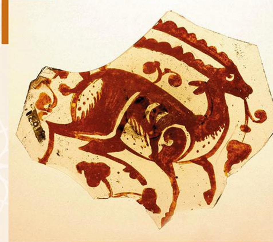
كسرة من الزجاج ذي البريق المعدني بزخارف حيوانية العصر الفاطمي - القرن ٥ هـ / ١١ م

يُعد العصر الفاطمي أحد أزهى العصور الإسلامية في مصر، من حيث الثراء والتنوع الفني، وقد ظهر انعكاس ذلك على مختلف الفنون التطبيقية، التي امتازت بتنوع موضوعاتها الزخرفية ما بين مناظر البلاط والحياة اليومية، والصيد والطرب والموسيقى، كما زاد الاهتمام أيضًا بالموضوعات الشعبية التي ظهرت بوضوح على التحف الفاطمية مثل لعبة التحطيب.