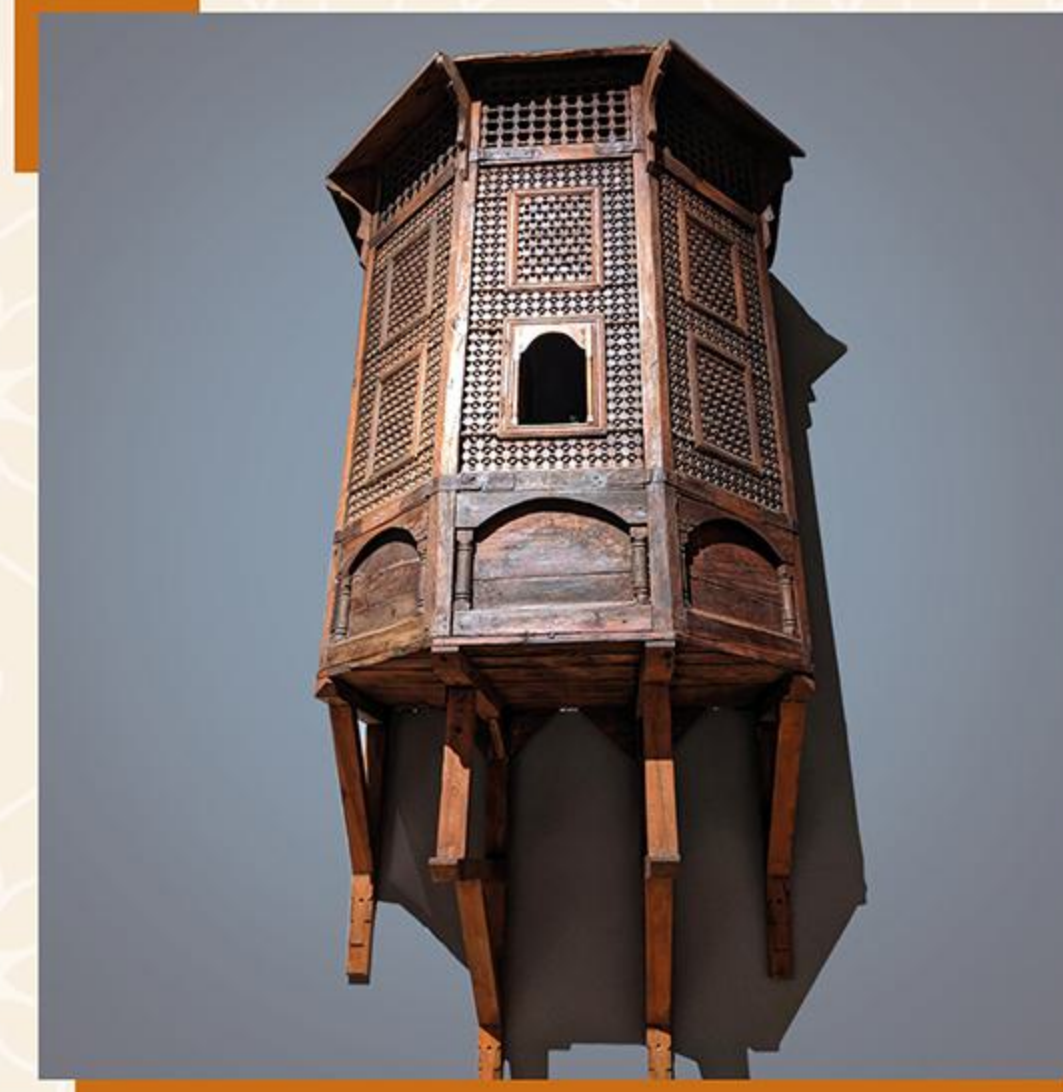
مشربية من الخشب - مصر العصر العثماني - القرن ١٢ هـ / ١٨ م

تم الامتزاج الفني والحضاري بين الآستانة والقاهرة في عهد العثمانيين، وظهر أثر ذلك على ما أنتج من الفنون سواء بالقاهرة أو في غيرها من المدن العثمانية، ويشهد على ذلك المجموعات الفنية المحفوظة بالمتحف، مثل الخزف والنسيج والسجاد والأخشاب والعاج وكذلك الحلي والأسلحة وغيرها.