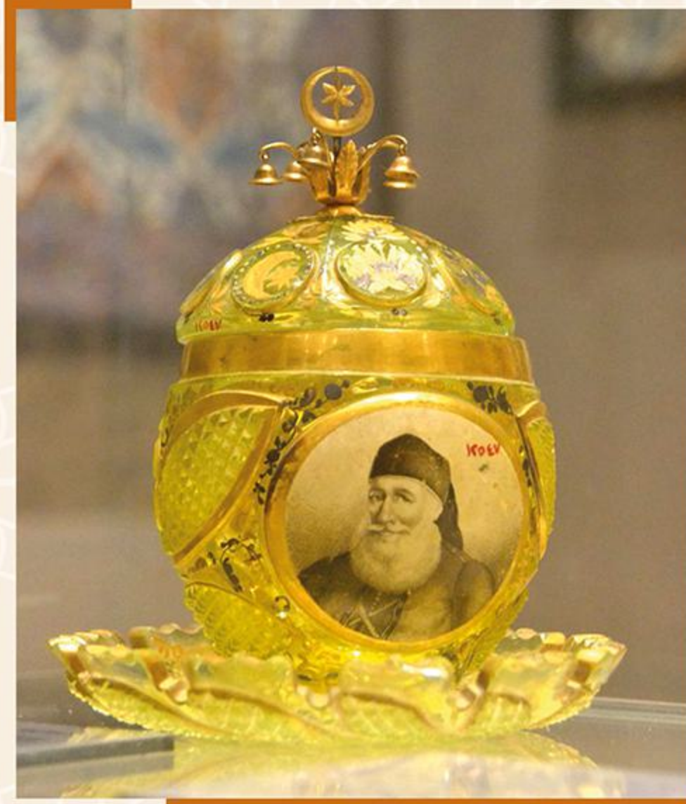
بونونيرة من الزجاج تحمل صورة الوالي العثماني محمد علي ١٧٦٩ - ١٨٤٩

دخلت مصر بعد ذلك تدريجيًا مرحلة تاريخية وفنية جديدة عُرفت بعصر الأسرة العلوية، ولعل أهم ما يميزها زيادة التأثيرات الأوروبية الوافدة عليها. ويضم متحف الفن الإسلامي مجموعة كبيرة من فنون عصر أسرة محمد علي.