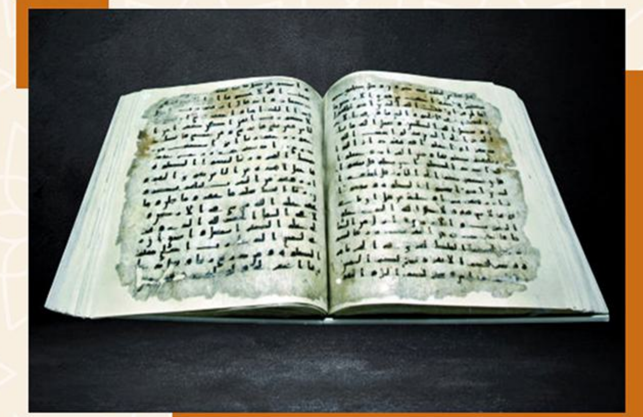
أقدم نسخة مصحف عليها علامات تشكيل - مصر العصر الأموي - القرن ٢ هـ / ٨ م

اعتمدت الحضارة الإسلامية على العديد من الأسس مثل القرآن الكريم والسنة واللغة العربية، أبرز هذه الشواهد الباقية أقدم نسخة مصحف عليها علامات التشكيل، وأقدم نسخة باقية لمفتاح الكعبة الشريفة.