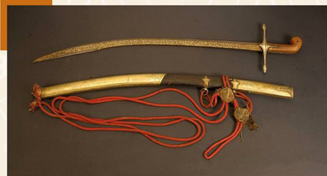
سيف السلطان المملوكي طومان باي العصر المملوكي - القرن ١٠ هـ / ١٦ م

كما تضمّنت المتحف قاعات للعملات والسلاح وفنون شرق العالم الإسلامي بإيران وتركيا والهند وقاعات مخصصة للكتابات العربية والإسلامية وقاعات للنسيج والسجاد، وقاعة للحياة اليومية في المنزل الإسلامي، تعكس بدورها جوانب من الحياة اليومية، ومظاهر الاحتفالات والزواج في الحضارة والتاريخ الإسلامي، وقاعة للحدائق والمياه وأخرى للعلوم والفلك، لينتهي هذا العرض المتحفي الأضخم للفنون الإسلامية على مستوى العالم بقاعة الطب محفوفة في رونق وبهاء بمنجزات الطب والجراحة.