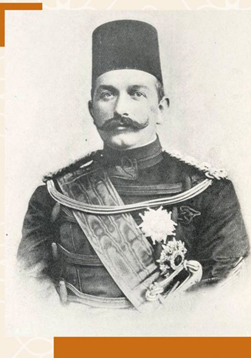
الخديوي عباس حلمي الثاني