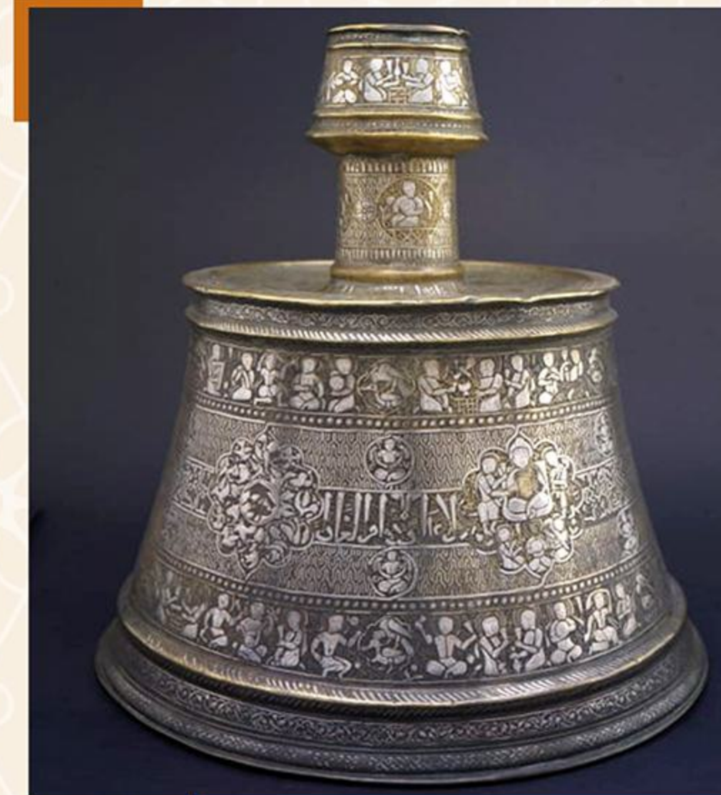
شمعدان من النحاس المكفت بالفضة يحمل اسمي الحاج إسماعيل ومحمد بن فتوح الموصل مصر أو الموصل - العصر الأيوبي - القرن ٧ هـ / ١٣ م

شهد العصر الأيوبي انتشار فن التكفيت في زخرفة المعادن، وبرز الصناعات الأيوبيون بمصر وسوريا في صناعة الخزف المرسوم بألوان متعددة تحت طلاء زجاجي شفاف. كما أبدع الزجاجون في أسلوب الزخرفة بالألوان المتعددة، واستمر كذلك أسلوب الحسوات المُجمَّعة في صناعة وزخرفة الأخشاب.